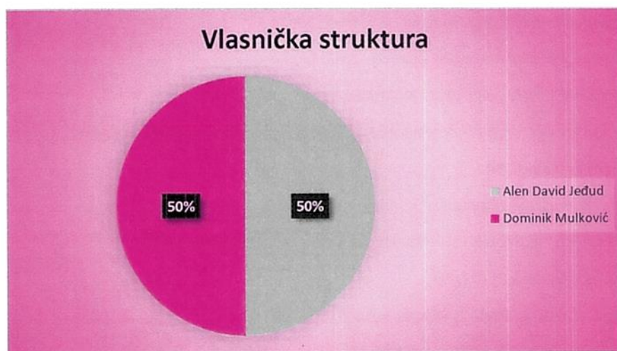
Vlasnička struktura tvrtke