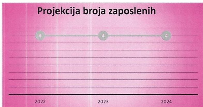
Grafički prikaz: Plan kretanja broja zaposlenih po godinama

Sukladno navedenim podacima vidljivo je kako dužnik od 30.06.2022. pa do trenutka predaje predstečajne dokumentacije zbog trenutne ekonomske situacije unutar društva nije bio u mogućnosti zapošljavati nove djelatnike. Dužnik želi istaknuti kako na dan predaje predstečajne dokumentacije ima sigurna radna mjesta koja nisu ugrožena te će u periodu restrukturiranja nastojati zapošljavati djelatnike ovisno o potrebama posla koji se obavlja.